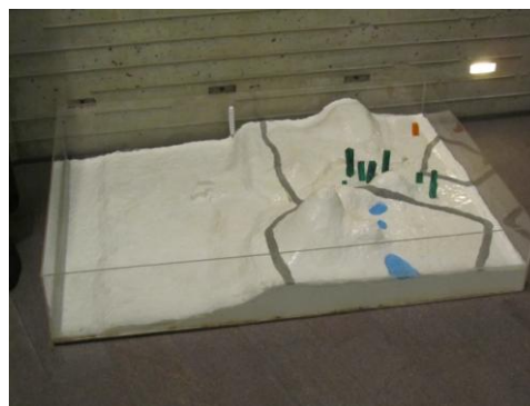
理数科物理班作成の子吉川河口付近 (右上のオレンジが由利高校) (中央の灰色の線が国道 7 号線)